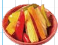
Mexican Pickles 380yen メキシカンピクルス 旬野菜のほんのリピリ辛ピクルス