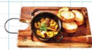
Shrimp Ajillo 880yen エビとマッシュルームのアヒージョ 熟々アンチョビガーリックオイル煮