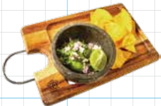
Guacamole 600yen フレッシュワカモレ 自家製アボカドディップ