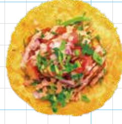
Spicy Lamb 300yen スパイシーラム Ground Lamb, Harissa Mayo