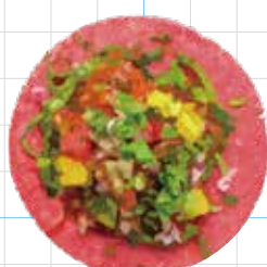
VEGAN 300yen ヴィーガン Seasonal Vegetables, Vegan Salsa