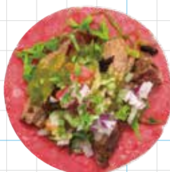
Beef Tongue 350yen 牛タン Slow Cooked Beef Tongue, Salsa Verde