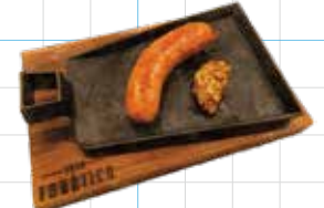
Chorizo 580yen チョリソー