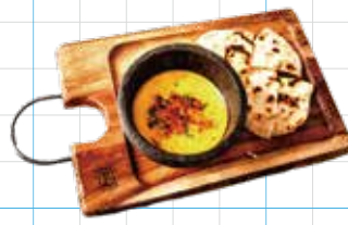
Queso Fundido 950yen メキシカンチーズフォンデュ 3種のチーズをブレンドしたとろーりチーズディップ