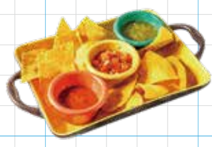
Chips + 3 kinds of Salsa 450yen チップス & 3種のサルサ トルティーヤチップスと3種の自家製サルサ