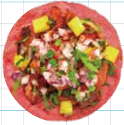
Al Pastor 260yen 名物! アルパストール・ポーク Adobo Chilli Marinated Pork, Pineapple

● BEET ビーツ ● YELLOW CORN トウモロコシ ● CHARCOAL 竹炭 ● CUMIN & TURMERIC クミン&ターメリック