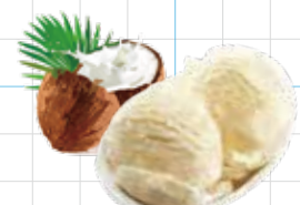
Coconut Ice Cream 300yen ココナッツアイスクリーム