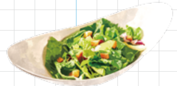
Caesar Salad 800yen シーザーサラダ