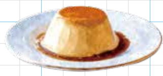
Mexican Pudding 550yen なめらかメキシカンプリン