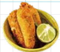
Jalapeño Poppers 500yen ハラペーニョポッパー クリームチーズを詰めたハラペーニョフライ