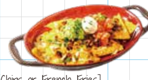
[Chips or French Fries] Cheese Nachos 800yen チーズナチョス [チップス or フライドポテト] チップス or フライドポテトのトロトロチーズオープン焼き