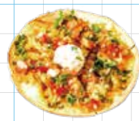
Open Pizza Quesadilla 850yen オープンピザケサディア チキンとハラペーニョのピザ風ケサディア