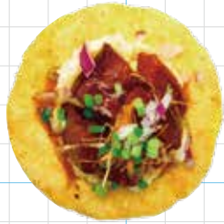
Kakuni Pork Belly 350yen 角煮ポーク Slow Cooked Pork Belly, Mashed Potato