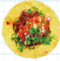
Chipotle Beef 300yen チポトレビーフ Braised Beef, Salsa Roja