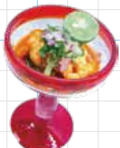
Shrimp Ceviche 950yen エビのセビーチェ 南米風魚介のマリネ