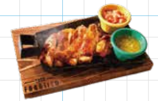
Cajun Grilled Chicken 980yen ケイジャングリルチキン じっくりマリネした鶏肉を熱々の鉄板で