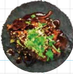
Chicken Mole 350yen チキンモレ Braised Chicken, Salsa Mole