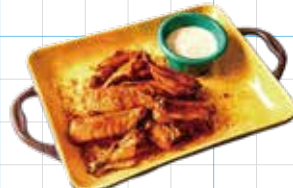
Chicken Wings 800yen チキンウィング 手羽先のピリ辛揚げ