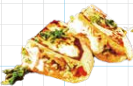
Avocado Crispy Cheese Gringa 700yen アボカドチーズのグリンガ カリカリチーズとアボカドの焼きタコス