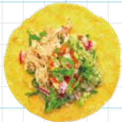
Guacamole Chicken 280yen ワカモレチキン Braised Chicken Leg, Avocado