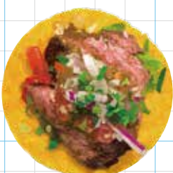
Beef Steak 450yen ビーフステーキ Hanger Steak, Salsa Verde