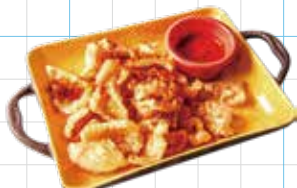
Chicharrón 550yen チチャロンチップス メキシコ屋台スナックの定番