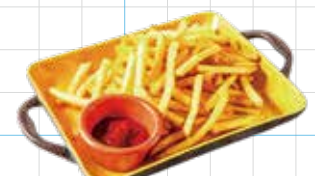
French Fries 500yen フライドポテト