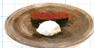
Gateau Chocolat 650yen しっとりガトーショコラ