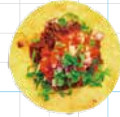
Chipotle Beef 300yen チポトレビーフ Braised Beef, Salsa Roja