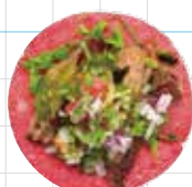
Beef Tongue 350yen 牛タン Slow Cooked Beef Tongue, Salsa Verde