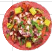
Al Pastor 260yen 名物! アルパストール・ポーク Adobo Chillli Marinated Pork, Pineapple