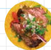
Beef Steak 450yen ビーフステーキ Hanger Steak, Salsa Verde