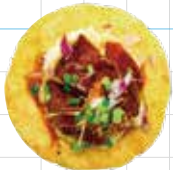
Kakuni Pork Belly 350yen 角煮ポーク Slow Cooked Pork Belly, Mashed Potato