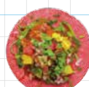
VEGAN 300yen ヴィーガン Seasonal Vegetables, Vegan Salsa