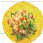
Guacamole Chicken 280yen ワカモレチキン Braised Chicken Leg, Avocado