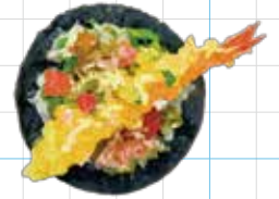
Tempura Shrimp 350yen 天ぷらシュリンプ Crispy Fried Shrimp, Chilli Mayo