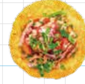
Spicy Lamb 300yen スパイシーラム Ground Lamb, Harissa Mayo