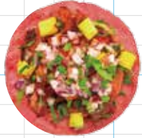
Al Pastor 260yen 名物！アルパストール・ポーク Adobo Chilli Marinated Pork, Pineapple