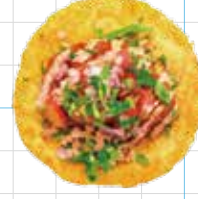
Spicy Lamb 300yen スパイシーラム Ground Lamb, Harissa Mayo