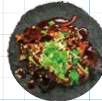
Chicken Mole 350yen チキンモレ Braised Chicken, Salsa Mole