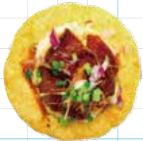
Kakuni Pork Belly 350yen 角煮ポーク Slow Cooked Pork Belly, Mashed Potato