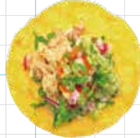
Guacamole Chicken 280yen ワカモレチキン Braised Chicken Leg, Avocado