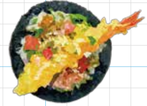
Tempura Shrimp 350yen 天ぷらシュリンプ Crispy Fried Shrimp, Chilli Mayo