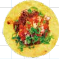
Chipotle Beef 300yen チポトレビーフ Braised Beef, Salsa Roja