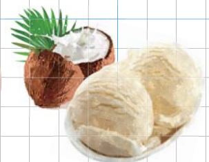
Coconut Ice Cream ココナッツアイスクリーム