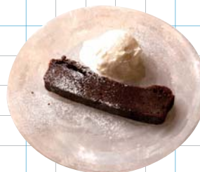
Chocolate Terrine チョコレートテリーヌ

Kirin Heartland Beer キリンハートランド +350YEN(税込385) House Wine 6oz (Red / White) ハウスワイン6oz 赤・白 +350YEN(税込385)