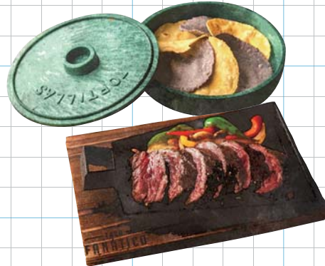
Fajita Hanger Beef +500yen(税込550) ファフィータハンガービーフ 最高品質プライムビーフのハラミを使用しています