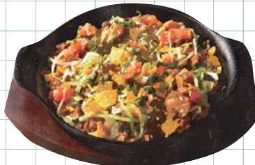
Grilled Cheese Taco Rice (Enzyme Brown Rice) 鉄板焼きチーズタコライス (酵素玄米使用)