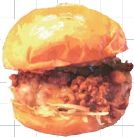
Mexican Zest Burger +200yen(税込220) メキシカンゼストバーガー