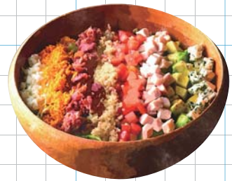
Cobb Salad コブサラダ

フライドポテト 100g 200yen トルティーヤ 3枚 100yen 酵素玄米 大盛 100yen