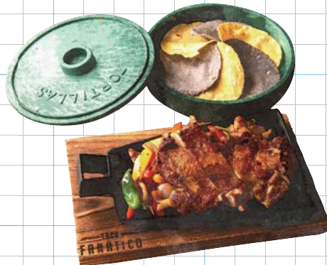
Fajita Cajun Chicken ファフィーダケイジャンチキン