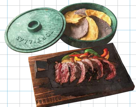
Fajita Hanger Beef +500yen ファフィーダハンガービーフ 最高品質プライムビーフのハラミを使用しています