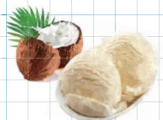
Coconut Ice Cream ココナッツアイスクリーム