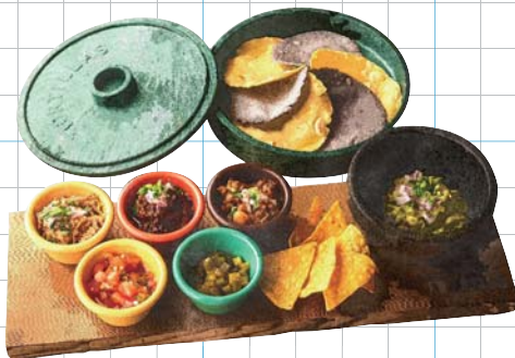
Tacos Set +200yen タコスセット