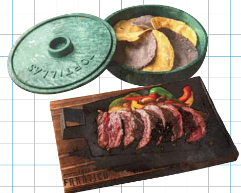
Fajita Hanger Beef +500yen ファフィータハンガービーフ 最高品質プライムビーフのハラミを使用しています