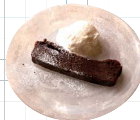
Chocolate Cake チョコレートケーキ