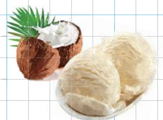
Coconut Ice Cream ココナッツアイスクリーム