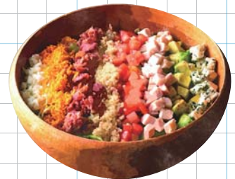
Cobb Salad コブサラダ