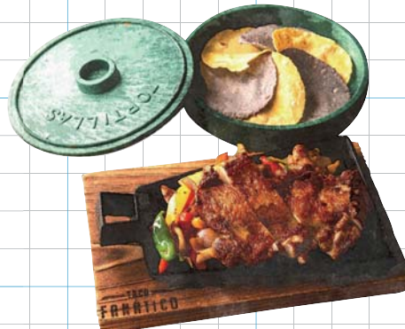
Fajita Cajun Chicken ファフィータケイジャンチキン