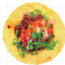
Chipotle Beef 350yen チポトレビーフ Braised Beef, Salsa Roja