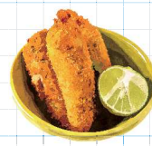
Jalapeño Poppers 550yen ハラペーニョポップパー クリームチーズを詰めたハラペーニョフライ