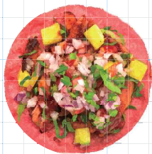
Cajun Pork 290yen ケイジャンポーク Adobo Chilli Marinated Pork, Pineapple