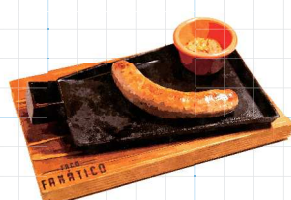
Sausage with Black Pepper 750yen 黒胡椒風味の極太ソーセージ ジュシーな生ソーセージ