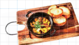
Shrimp Ajillo 950yen エビとマッシュルームのアヒージョ 熱々アンチョビガーリックオイル煮