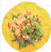
Guacamole Chicken 290yen ワカモレチキン Braised Chicken Leg, Avocado