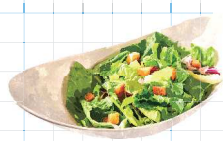
Caesar Salad 880yen シーザーサラダ チェダーチーズとトルティーヤ チップス入りのメキシカン仕立て