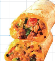
Cajun Beef Burrito 680yen ケイジャンビーフブリット 柔らかく煮込んだ牛肉とスパイシーな ケイジャン風味のソース