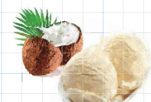
Coconut Ice Cream 350yen ココナッツアイスクリーム