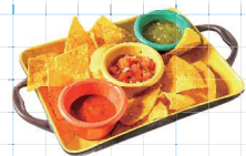
Chips + 3 kinds of Salsa 480yen チップス & 3種のサルサ トルティーヤチップスと3種の自家製サルサ