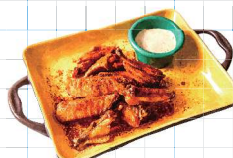
Chicken Wings 880yen チキンウイング 手羽先のピリ辛揚げ