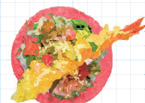
Tempura Shrimp 380yen 天ぷらシュリンプ Crispy Fried Shrimp, Ranch Sauce