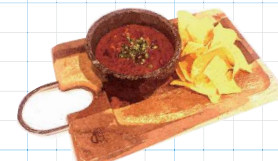
Menudo 750yen メヌード メキシカントリッパの煮込み