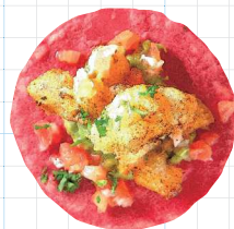
Vegan 320yen ヴィーガン Seasonal Vegetables, Vegan Salsa