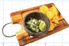
Guacamole 650yen フレッシュワカモレ 自家製アボカドディップ