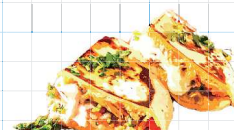
with herb marinated pork Crispy Cheese Gringa 650yen ハーブポークのチーズグリンガ ハーブでマリネしたポークと焼きチーズの トルティーヤサンド