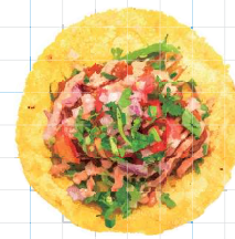
Spicy Lamb 350yen スパイシーラム Ground Lamb, Harissa Mayo